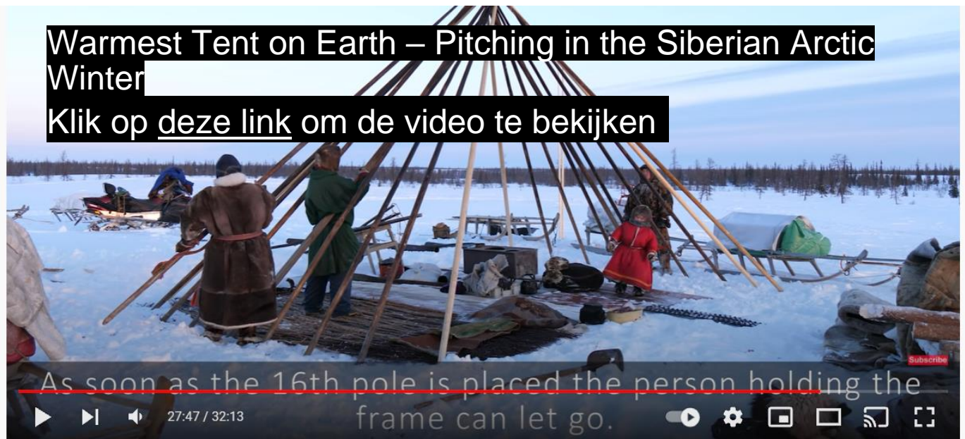
Warmest Tent on Earth - Pitching in the Siberian Arctic Winter - Ненецкая палатка чум